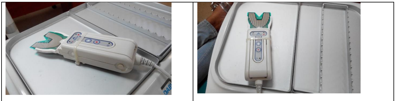
Рис. 1. Загальний вигляд системи T-scan.

Для більш точної діагностики оклюзійних порушень у пацієнтів обох груп застосовувався діагностичний комплекс T-scan. Дана система спрощувала корекцію оклюзії як на етапах підготовки- на тимчасових конструкціях, так і підчас завершального протезування. Застосування комп'ютерного аналізу дозволило отримати об'єктивні дані стосовно сили, часу виникнення та послідовності оклюзійних контактів, точно виявляти супраконтакти, порівнювати жувальне навантаження на лівому та правому боці щелеп, оцінювати стан жувальних м'язів. На відміну від класичної методики оцінки оклюзійних контактів за допомогою оклюдограмм, застосування системи T-scan сприяло отриманню більш точних та якісних даних, дозволяло зберігати та порівнювати отриману інформацію на всіх етапах лікування: від підготовки до завершального протезування. (Рис.1-3).