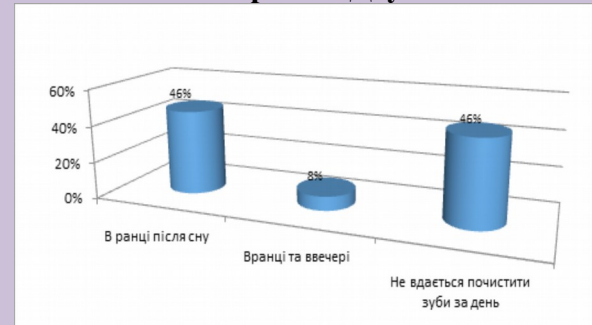
Кратність гігієнічних процедур у дітей із синдромом Дауна

Діти із синдромом Дауна віднесені до групи з високим ризиком розвитку стоматологічних захворювань. Для кожного з дітей, відповідно з отриманими даними, було розроблено індивідуальні програми профілактики.